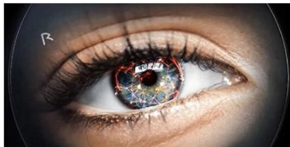
Ilustracija 1 Vidljivi Rodenstock zaštitni znak